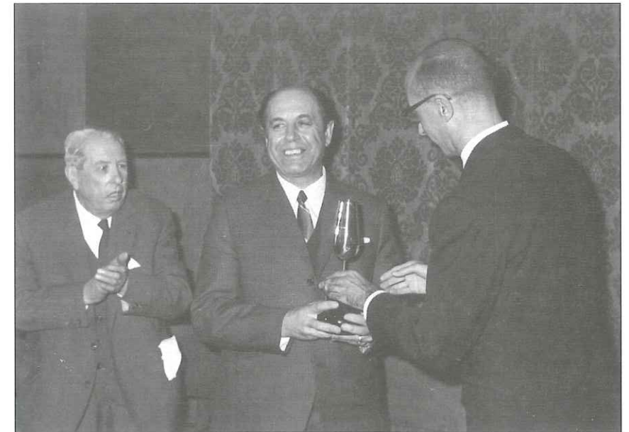
Año 1966. Antonio Mairena, recibiendo el Premio Nacional, otorgado a su grabación discográfica "La gran historia del cante gitano andaluz"; en presencia del maestro Aurelio Sellé, que también recibiría el Premio Nacional de Cante.